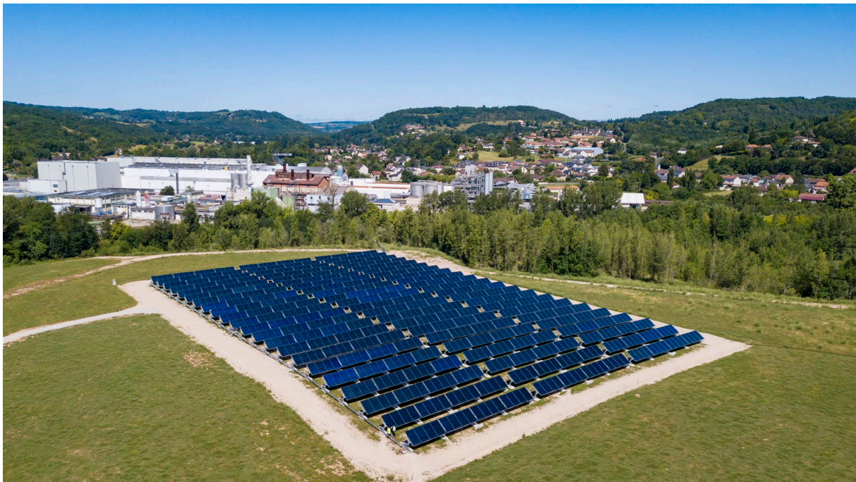
Centrale solaire thermique de CONDAT (24)

A propos de NEWHEAT : Créée en 2015, NEWHEAT est une jeune entreprise innovante dont l'activité est de développer, construire, financer et exploiter des projets de production de chaleur solaire pouvant également intégrer de la récupération de chaleur fatale, à destination des grands sites industriels et des réseaux de chaleur urbains. Basée à Bordeaux, la société compte aujourd'hui 18 collaborateurs et dispose d'un savoir-faire technique important lui permettant de concevoir, piloter la réalisation et optimiser le fonctionnement de ses centrales de production de chaleur renouvelable.